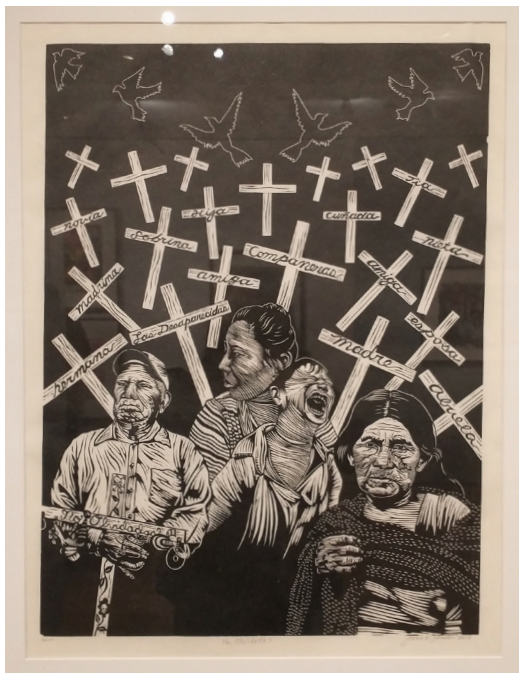
Juan R. Fuentes, No Olvidadas , 2019.

¿De qué forma puede ayudar el arte a transmitir historias importantes que inspiran acción?