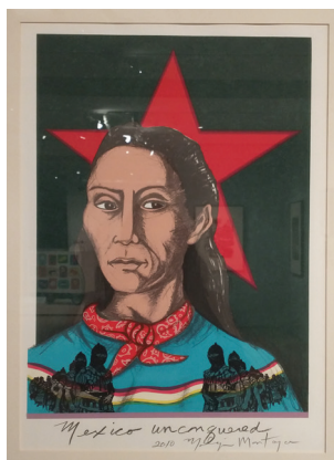
Malaquías Montoya, Mexico Unconquered , 2010.

¿De qué formas podría demostrar orgullo en su comunidad?